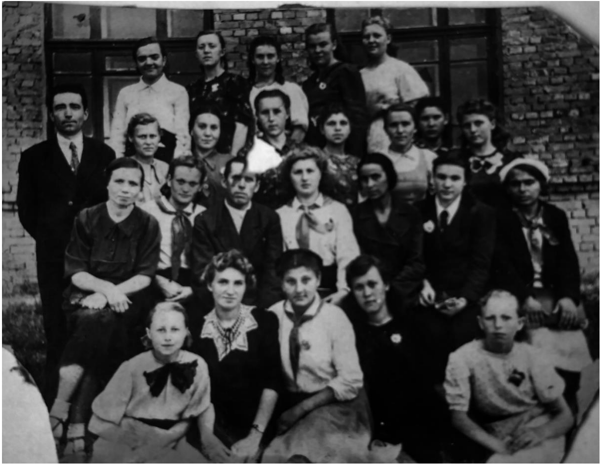
На фото: 6 клас 108 школи, 1945 рік