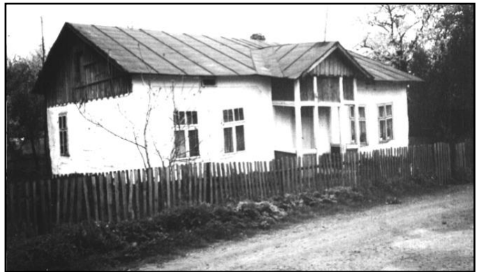
Хата Берка Земмеля (світлина 1990 р.)

Фотографії зроблені в с.Тяпче, Долинського р-ну, Івано-Франківської обл.